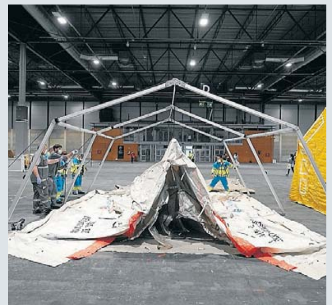
El complex d'Ifema, a Madrid, ja acull un centenar de pacients lleus.

Simón també va avisar que els experts basaven el seu pronòstic en les dades de contagis identificats actualment, que probablement disten de la realitat, a la qual es podrà aproximar-se a mesura que es vagin fent tests ràpids. Aquest dissabte es va anunciar l'adquisició de 640.000 kits, xifra que s'anirà incrementant fins a arribar als sis milions pròximament, va prometre Sánchez. Simón va destacar que els primers be-