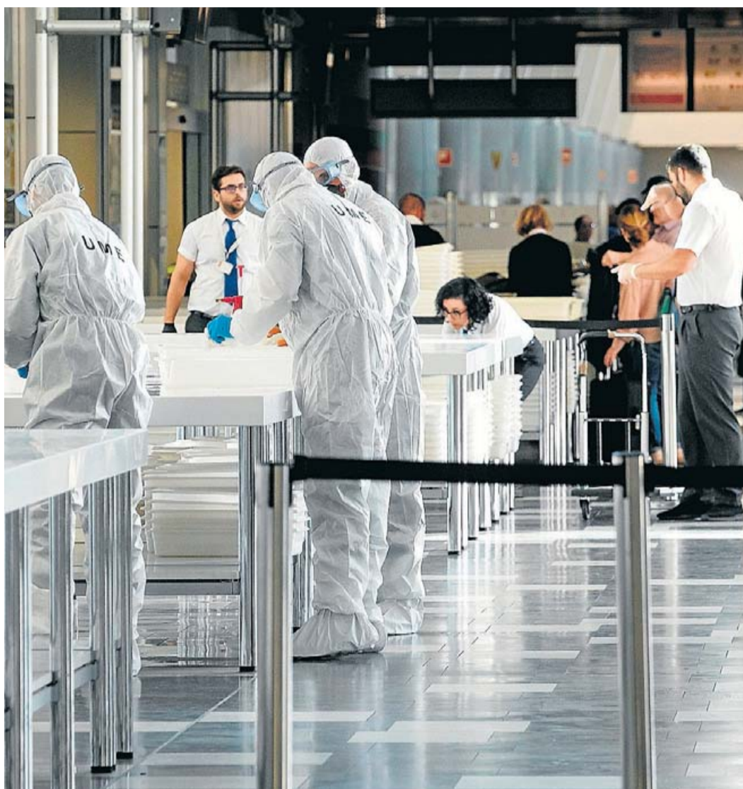
Membres de la Unitat Militar d'Emergència desinfectant divendres una de les zones d'embarcament de l'aeroport de Gran Canària.

El president de la Generalitat, Quim Torra, demana des de la setmana passada el tancament de fronteres a Catalunya –com a focus crític del Covid-19, juntament amb la Comunitat de Madrid– i paraitzar la producció. “Quin sentit té que les persones que avui [ahir per al lector] s'han quedat a casa demà hagin