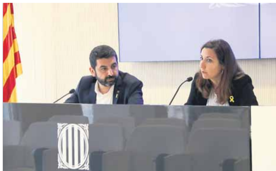
El conseller Chakir El Homrani i la directora de la DGAIA, ahir a la tarda

La majoria de joves tenen entre 14 i 17 anys,