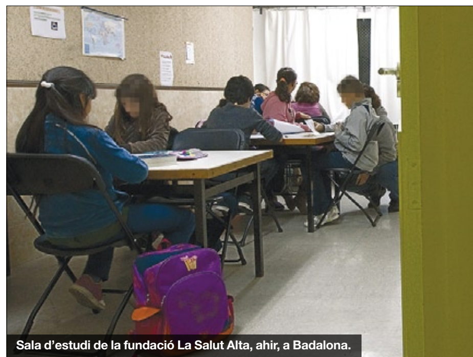
Sala d'estudi de la fundació La Salut Alta, ahir, a Badalona.