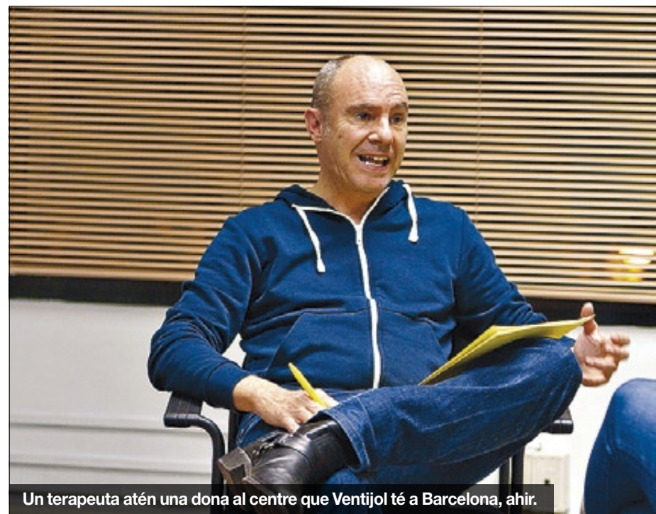
Un terapeuta atén una dona al centre que Ventijol té a Barcelona, ahir.