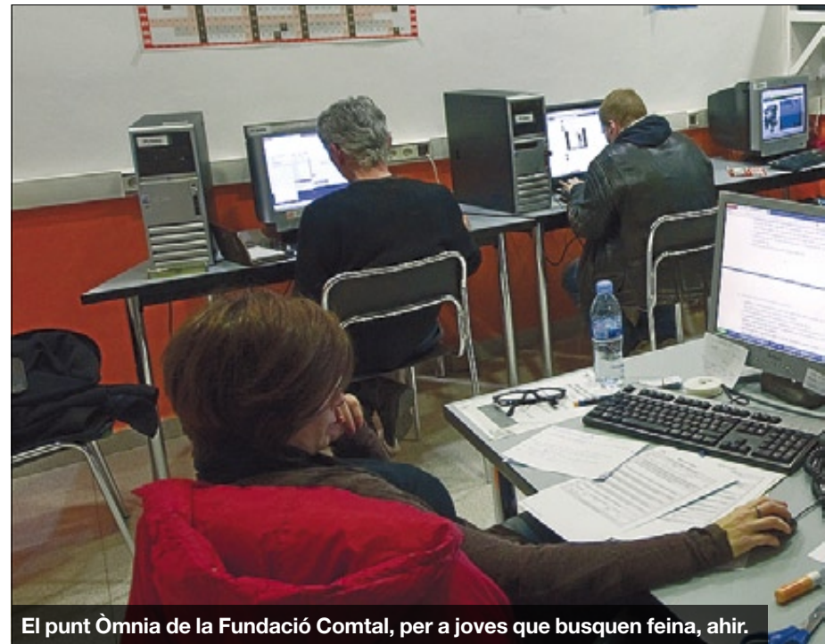
El punt Òmia de la Fundació Comtal, per a joves que busquen feina, ahir.