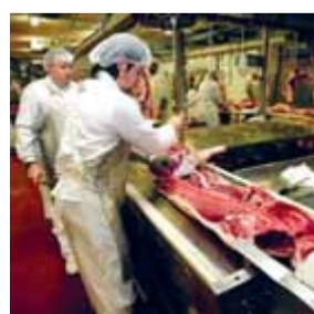
L'escorxador on treballen força romanesos ■ J. RAMOS

Àrea de Girona dona feina a desenes de romanesos, tant a l'escorxador com en les tasques d'envasat. Lideren les nacionalitats a la Segarra. A la Garrotxa, en canvi, hi ha majoria d'indis.