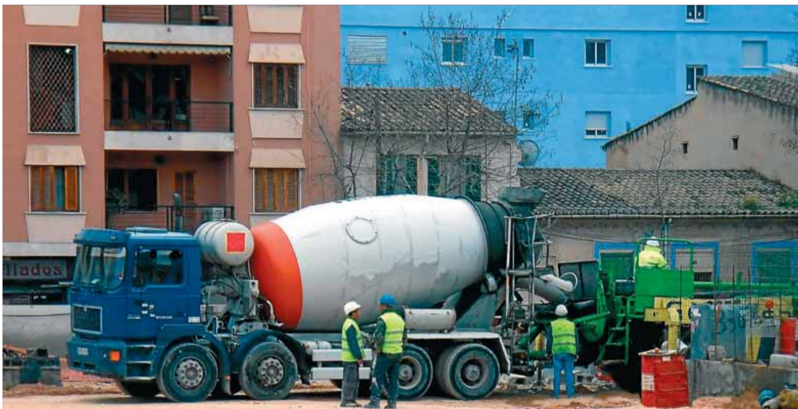
La caiguda del sector de la construcció ha modificat el perfil dels treballadors estrangers ■ EL PUNT AVUI