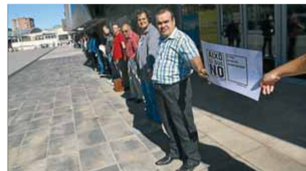
Una protesta de les entitats de suport als discapacitats davant de la Generalitat

L'Assemblea Contra els Desallotjaments del Poblenou va denunciar, ahir, des del solar del carrer Puigcerdà on hi havia la nau de què un grup d'immigrants subsaharians van ser desallotjats aquest estiu, l'incompliment dels acords a què van arribar els afectats amb les administracions, bàsicament la Subdelegació del Govern que no ha donat els permisos de residència i treball promesos. ■ A. PUIG