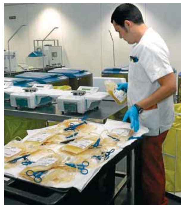
La regeneració de teixits a partir d'altres espècies animals centra la recerca dels bancs de sang i teixits ■ JOSEP LOSADA

■ Científics americans proven amb èxit un nou tractament que permet curar lesions musculars greus