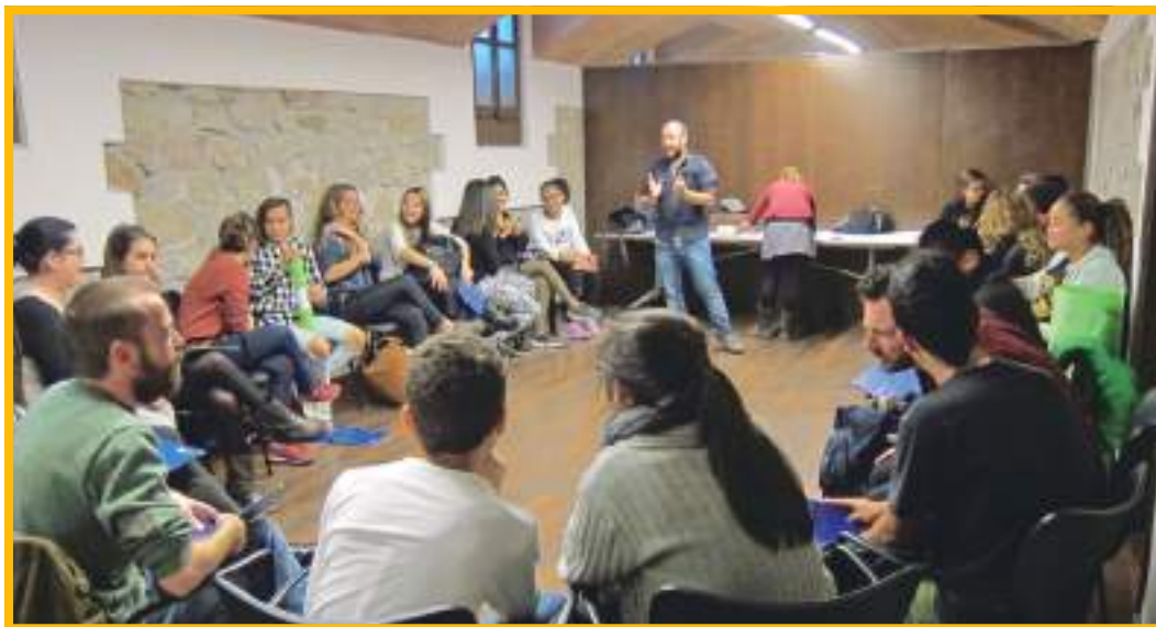
Imatge extreta de la Primera Trobada, PINCAT 2015