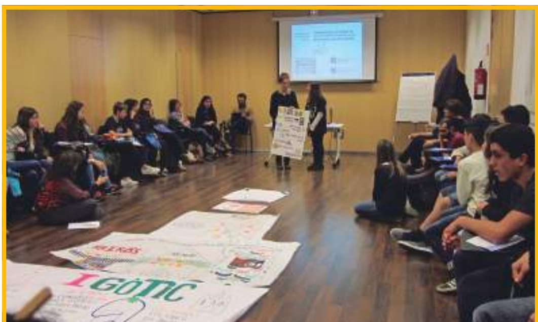
Imatge extreta de la Primera Trobada, PINCAT 2015