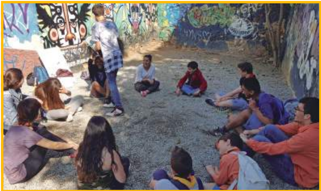
Imatge extreta de la Segona Trobada, PINCAT 2016

Seguidament, els infants de l'Esplai Espurnes van preparar una dinàmica per recordar la importància de la participació. La idea d'aquesta activitat era recordar als presents la importància que té que els infants participin.