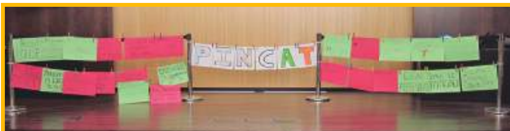
Imatge extreta de la Primera Trobada, PINCAT 2015