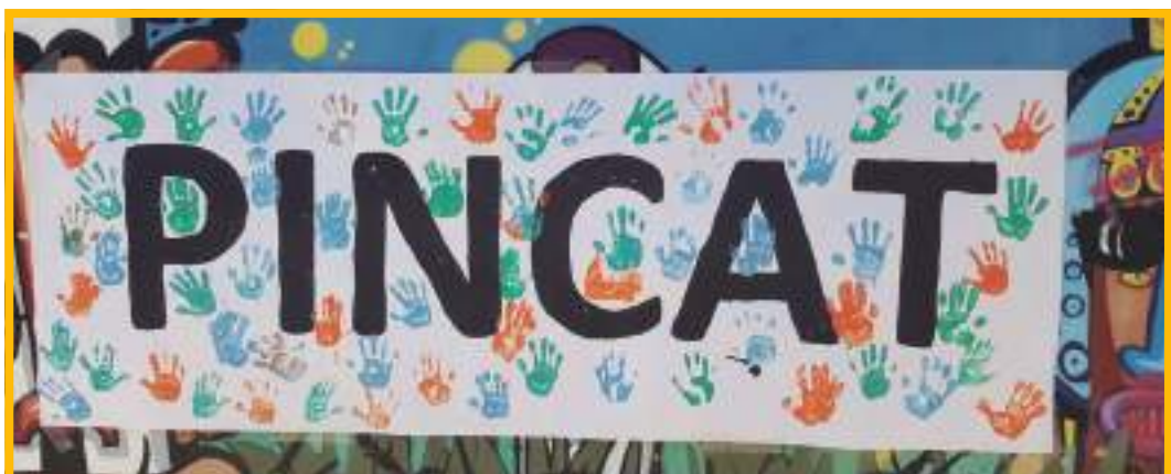
Imatge extreta de la Segona Trobada, PINCAT 2017