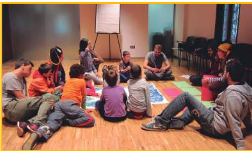
Imatge extreta de la Primera Trobada d'Infants, PINCAT 2015