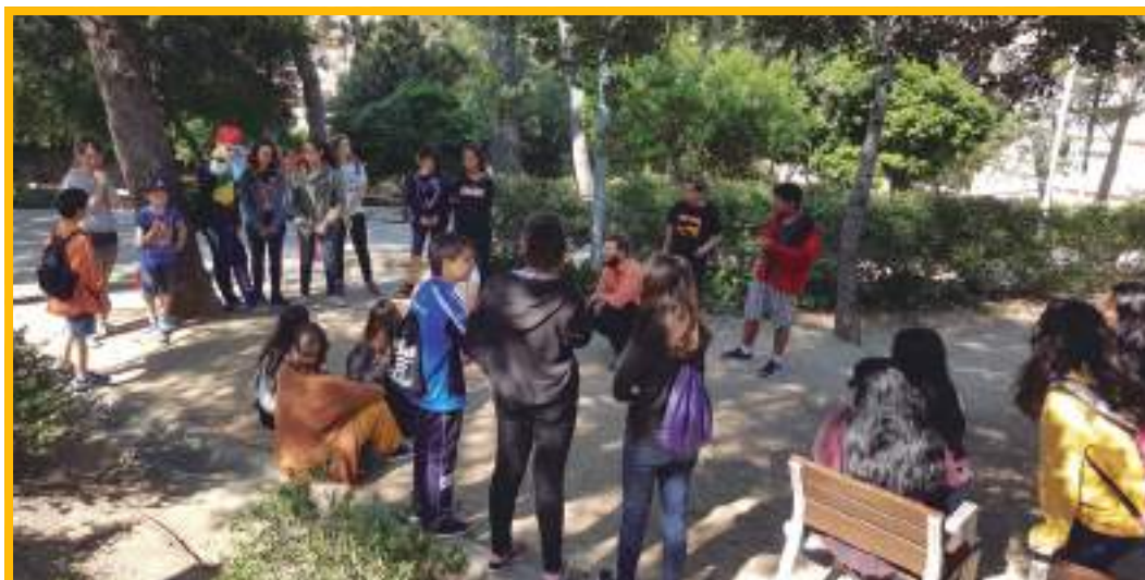
Imatge extreta de la Segona Trobada, PINCAT 2016

Un cop finalitzada aquesta primera part, les diferents entitats assistents van exposar sis experiències en relació a la participació. Aquestes propostes s'havien acordat a la primera trobada feta al novembre.