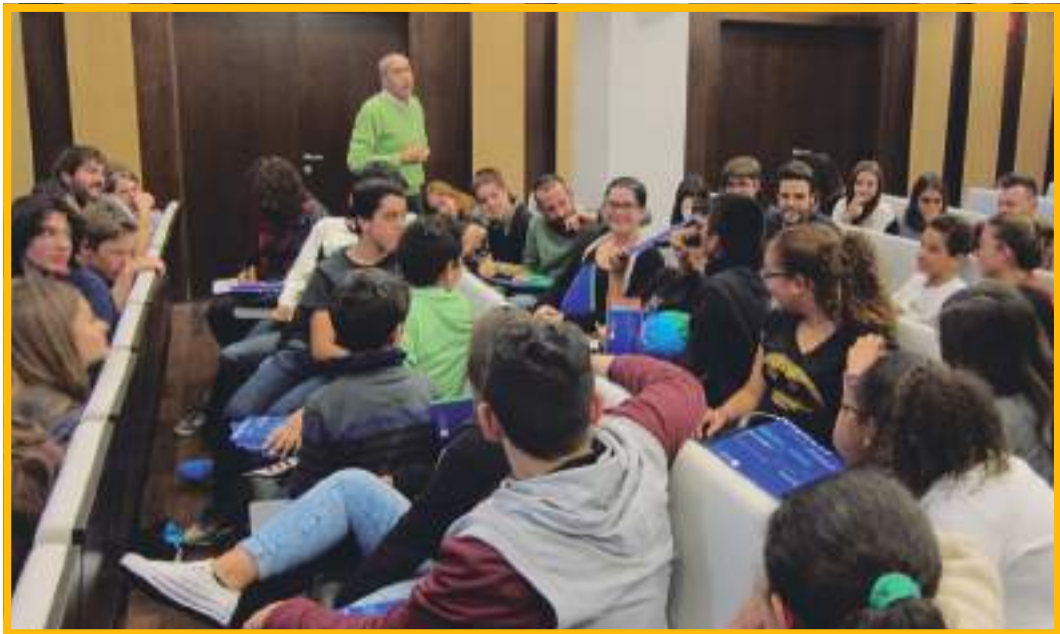
Imatge extreta de la Primera Trobada, PINCAT 2017