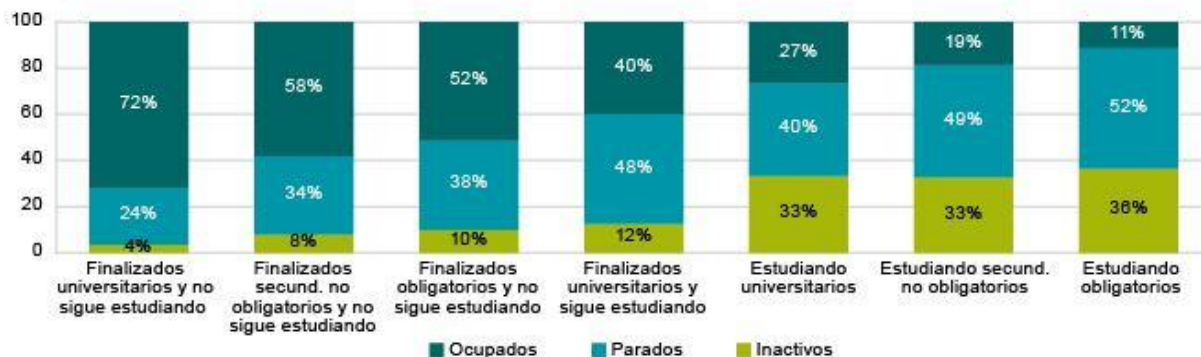
Gráfico 3. Situación laboral de los jóvenes en función del estado y nivel de estudios alcanzado. España. 2011