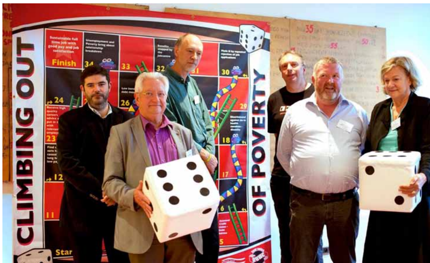
1. La contribución de la Política de Cohesión a la inclusión social - ¿Qué papel juegan las ONG? Evaluación intermedia de EAPN del actual periodo programático y perspectiva para después de 2013 (ING / FRA); 2. Respuesta al 5º Informe de Cohesión Territorial, Económica y Social de la Comisión Europea (ING, IT). Enero 2011

EAPN ha ido más allá incluso, iniciando y coordinando una campaña conjunta que reúne a 19 ONG sociales en la defensa de la cuota mínima para el FSE, los fondos para la reducción de la pobreza, y que se haga YA. En la página 11 de este número, hay un artículo completo dedicado a este tema.