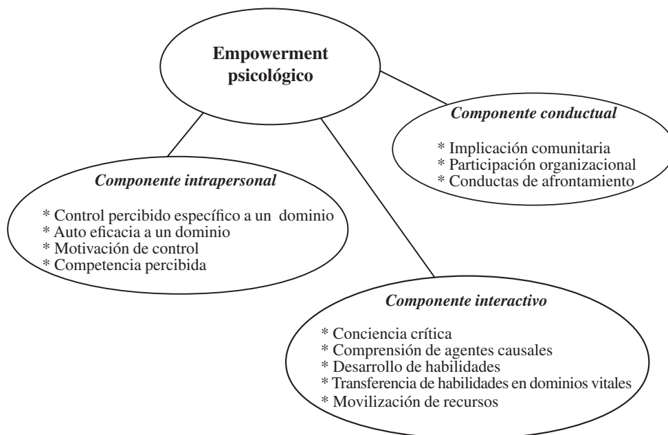
Figura 1. Red nomológica de la potenciación psicológica (Zimmerman, 1995).

constituyen la dimensión intra-personal de la potenciación psicológica. Concretamente, este componente intra-personal llega a incluir aspectos de personalidad (como el locus de control), cognitivos (como la auto-eficacia) y motivacionales.