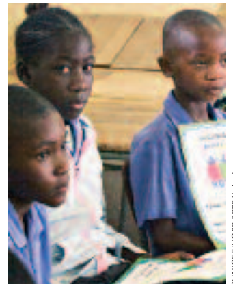
Estudiantes de cuarto curso con sus certificados de “Una ventana a la esperanza”, después de una sesión educativa sobre técnicas para la vida, en la escuela primaria de Ehenya, en la región nortea de Oshana, Namibia.

La misión de satisfacer los derechos de la infancia no es fácil; pero no es una tarea que pueda ignorarse. La Convención sobre los Derechos del Niño exige que las familias, comunidades y gobiernos reconozcan y cumplan con su responsabilidad fundamental de proteger y velar por los 2.200 millones de niños y niñas que hay en el mundo. Aunque creo que la comunidad internacional ha avanzado mucho en lo que se refiere a la puesta en práctica de la Convención, para que este éxito continúe se precisa la participación de los jóvenes y las comunidades. En último término, es la infancia la que determina el futuro moral y ético de las naciones. Es necesario que se oiga su voz.