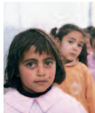
Una fila de estudiantes se dispone a entrar en clase en la escuela pública Timnin El-Tahta, situada en el Valle de Beqaa, al nordeste del Líbano.

En el vigésimo aniversario de la Convención sobre los Derechos del Niño, el sector privado tiene motivos más que suficientes para agradecer el interés que este tratado otorga a la capacidad para crear una nueva generación de ciudadanos, y para recordar que los niños y niñas son las flores de nuestra sociedad. Estamos muy contentos de que las ideas de la Convención nos hayan impulsado a actuar, y deseamos hacer todo cuanto podamos por promoverlas en el futuro.