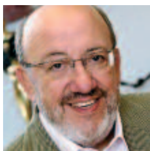
LOUIS MICHEL Comisario Europeo para el Desarrollo y la Ayuda Humanitaria

Estamos comenzando a ver progresos en lo que se refiere a los derechos de la infancia, y espero que en el 20 aniversario de la Convención, estos esfuerzos den aun más frutos.