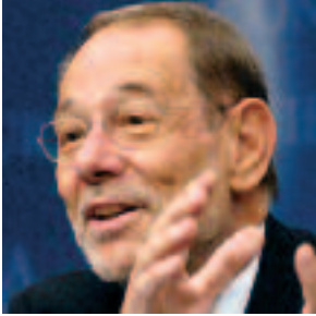
JAVIER SOLANA Alto Representante para la Política Exterior y de Seguridad Común, Secretario General del Consejo de la Unión Europea