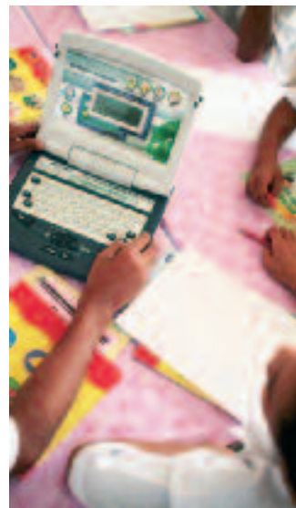
Niños y niñas colaboran en un proyecto empleando un microordenador, en la escuela primaria de la Isla de Timbang, en el estado de Sabah, Malasia.

En Malasia, la educación ya no es un sueño lejano, sino un compromiso que hemos asumido para con todos los niños y niñas. Basándonos en la Convención sobre los Derechos del Niño, continuaremos realizando esfuerzos para atender a los niños y niñas más vulnerables y aislados. Nuestra esperanza es construir un futuro mejor para los niños y niñas de nuestro país, que a su vez nos permita ver cómo ellos construyen un futuro mejor para nuestro mundo.