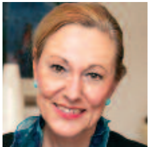
BENITA FERRERO-WALDNER Comisaria Europea de Relaciones Exteriores y Política de Vecindad

La versión completa de los ensayos de los Comisarios de la Unión Europea están disponibles en el sitio web de UNICEF en < www.unicef.org/rightsite >.