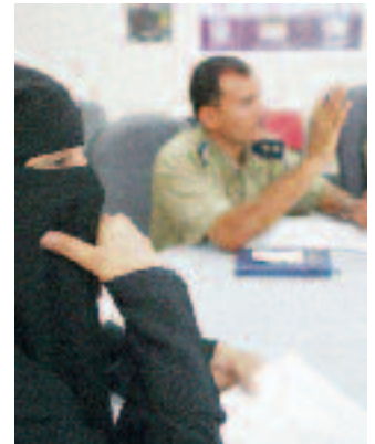
Autoridades gubernamentales participan en una sesión de formación sobre prevención de la trata de niños y niñas, en la Dirección de Desarrollo de Tihama, en la localidad de Hodeidah, el Yemen.

En el vigésimo aniversario de la Convención sobre los Derechos del Niño, quiero hacer un llamamiento urgente a todos los gobiernos que enfrentan el problema de la trata de niños y niñas, para que emprendan acciones audaces y coordinadas, a escala nacional e internacional, con el objeto de poner fin a la explotación de los niños y niñas del mundo. La práctica continuada de la trata de menores de edad está poniendo en peligro la misión de promover los derechos de la infancia y perjudicando los logros que se han alcanzado desde que se ratificara la Convención. Tengo la esperanza de que gracias a los esfuerzos conjuntos de los gobiernos, las organizaciones internacionales y los ciudadanos, haremos de la promoción de los derechos de la infancia una realidad y pondremos fin a la trata de niños y niñas.