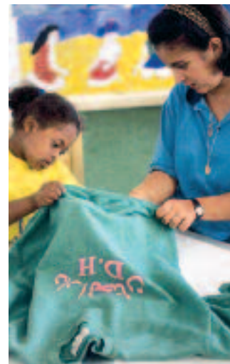
Una niña y una terapeuta en el centro Dar el Hanan (Casa de la Merced) para niños discapacitados de la ciudad portuaria de Alejandría, Egipto.

Al final, este movimiento por los derechos de la infancia que parte del corazón puede convertirse en el legado más importante de la Convención. Durante las décadas en que se elaboró y adoptó, la Convención supuso una primicia en la historia, un momento en el que la comunidad de naciones reconocía la dignidad y el valor intrínseco de todos los niños y niñas. La culminación llegará con otra primicia, el momento en que las comunidades de ciudadanos celebren el valor de cada niño o niña sin excepciones ni límites. Cuando esto ocurra, el antiguo refrán se habrá convertido en realidad: la piedra que los constructores rechazaron es ahora la piedra angular, y es admirable a nuestros ojos.