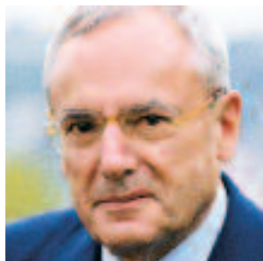
JACQUES BARROT Vicepresidente de la Comisión Europea y Comisario de Justicia, Libertad y Seguridad.