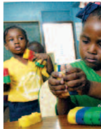
Una niña juega con unos módulos de plástico de colores en la escuela básica de Denham, en la parroquia de Kingston y St. Andrew, Jamaica.

Ninguna de estas medidas habría sido posible sin la conjugación de dos factores fundamentales: la voluntad de la Presidenta para darle a las políticas de protección a la infancia la prioridad que se merecen y una política macroeconómica seria, que asegure recursos para su implementación, independientemente de los shocks externos que esté viviendo la economía. Así, un importante beneficio de la regla de superávit fiscal que aplica Chile es que el gasto se desvincula de los componentes transitorios del ingreso, lo que permite que, en la coyuntura de crisis actual, los ahorros que hizo nuestro país durante la bonanza puedan ser utilizados. Esto permite asegurar la continuidad del sistema de protección social que es sello del gobierno de la Presidenta Bachelet y forma el núcleo central de la Convención sobre los Derechos del Niño.